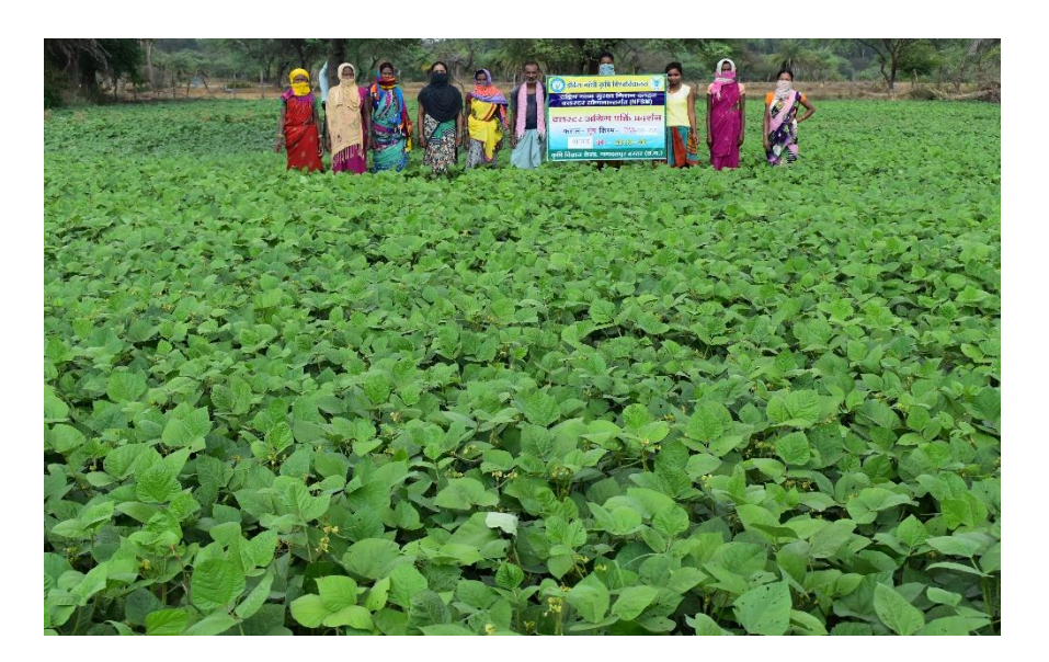
CFLD at Village-Belar,Block-Lohandiguda on Green gram